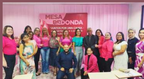
Mesa redonda: juntos por uma causa - conscientização e o poder da prevenção